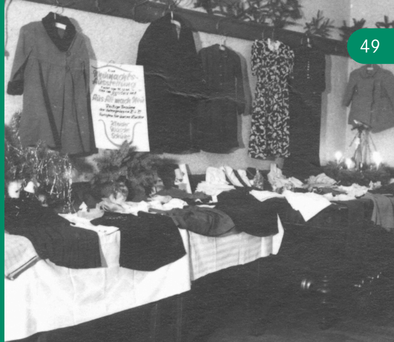
Spenden für die notleidende Bevölkerung – Der Anfang unserer Geschichte vor fast 80 Jahren

Mit der Nachlass-Spende können Sie neben Ihren Lieben auch eine gemeinnützige Organisation, wie die Stiftung Volkssolidarität Dresden bedenken. Hierfür ist eine Beratung notwendig, sprechen Sie uns gerne an.