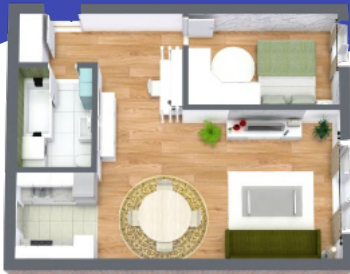
beispielhafte Abbildung Ein-Zimmer-Wohnung