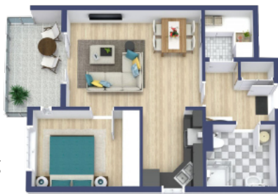
beispielhafte Abbildung Zwei-Zimmer-Wohnung